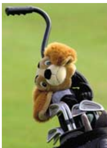
I väntan på starttid.