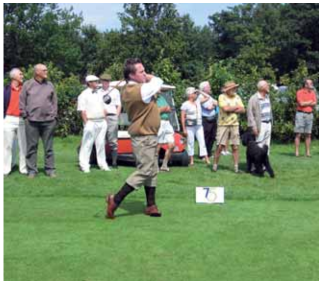
Svenske hickorymästaren Pierre Fulke slår ut.